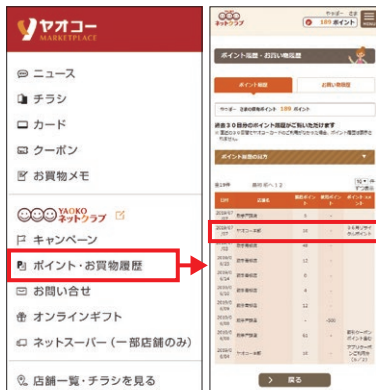
▲「ヤオコーアプリ」イメージ▲